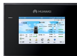
7インチトゥルーカラー タッチパネル