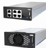
ホットスワップ対応の プライマリ、セカンダリ 電源モジュール